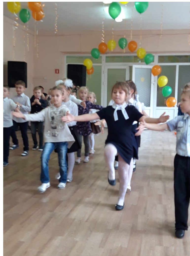
Участие детей подготовительной группы в празднике «Посвящение в первоклассники»