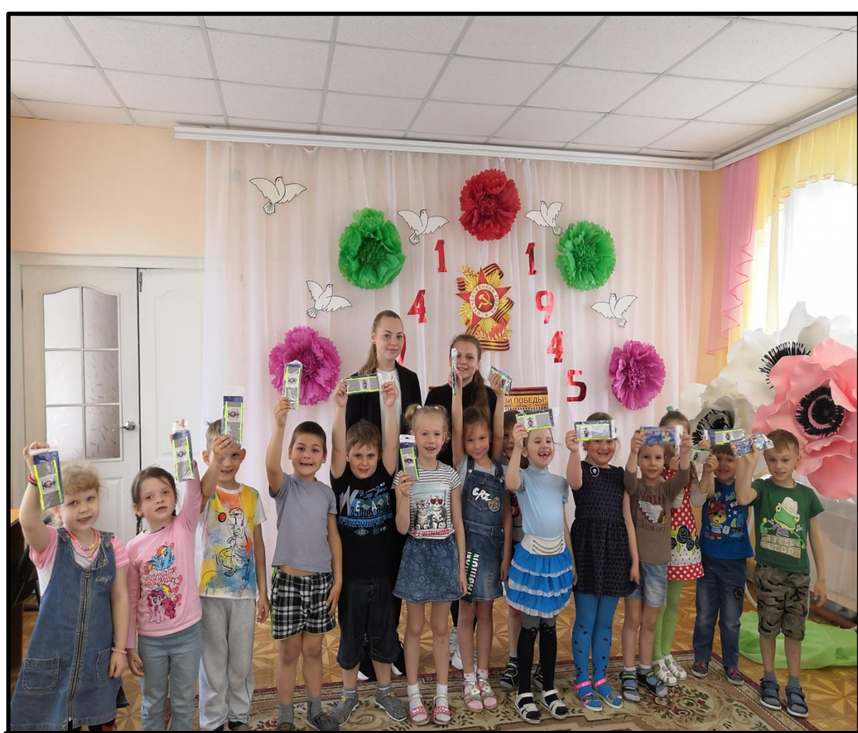
Мероприятие отряда инспекторов юного движения