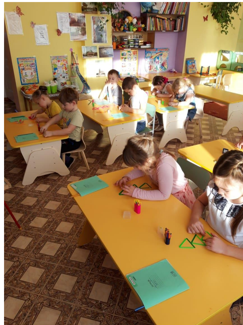
Модуль «Веселая логика и занимательная математика»