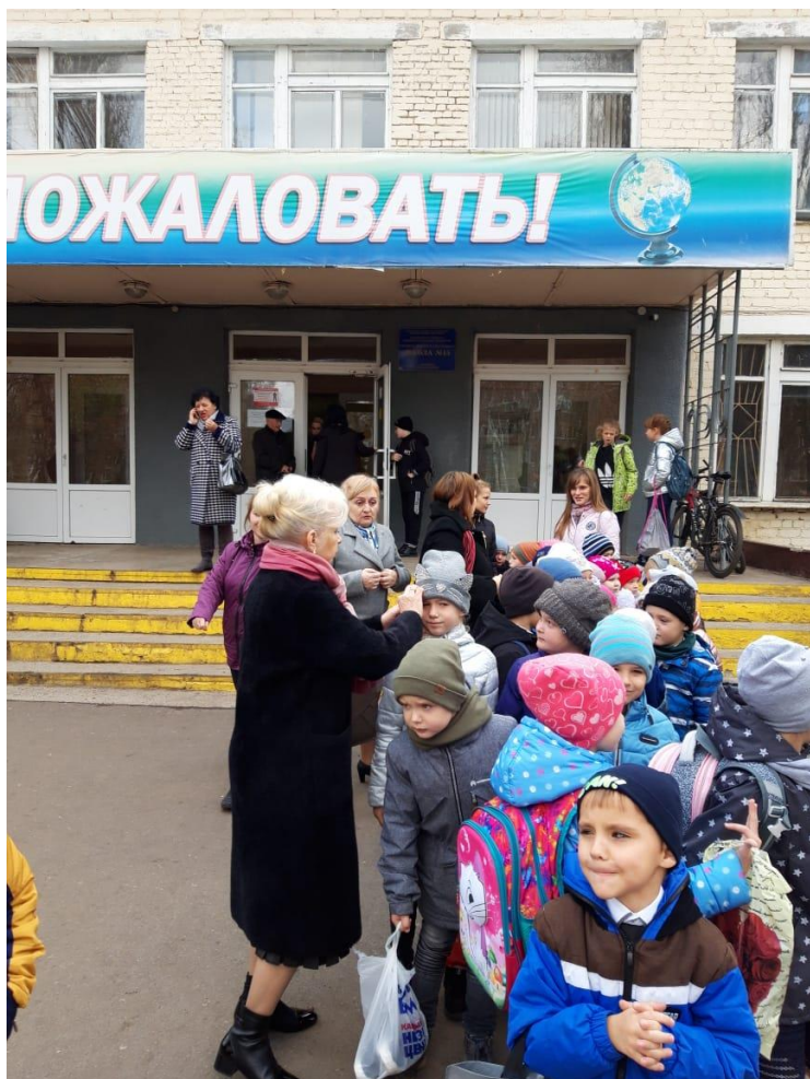
Экскурсия к МБОУ «СОШ №15»