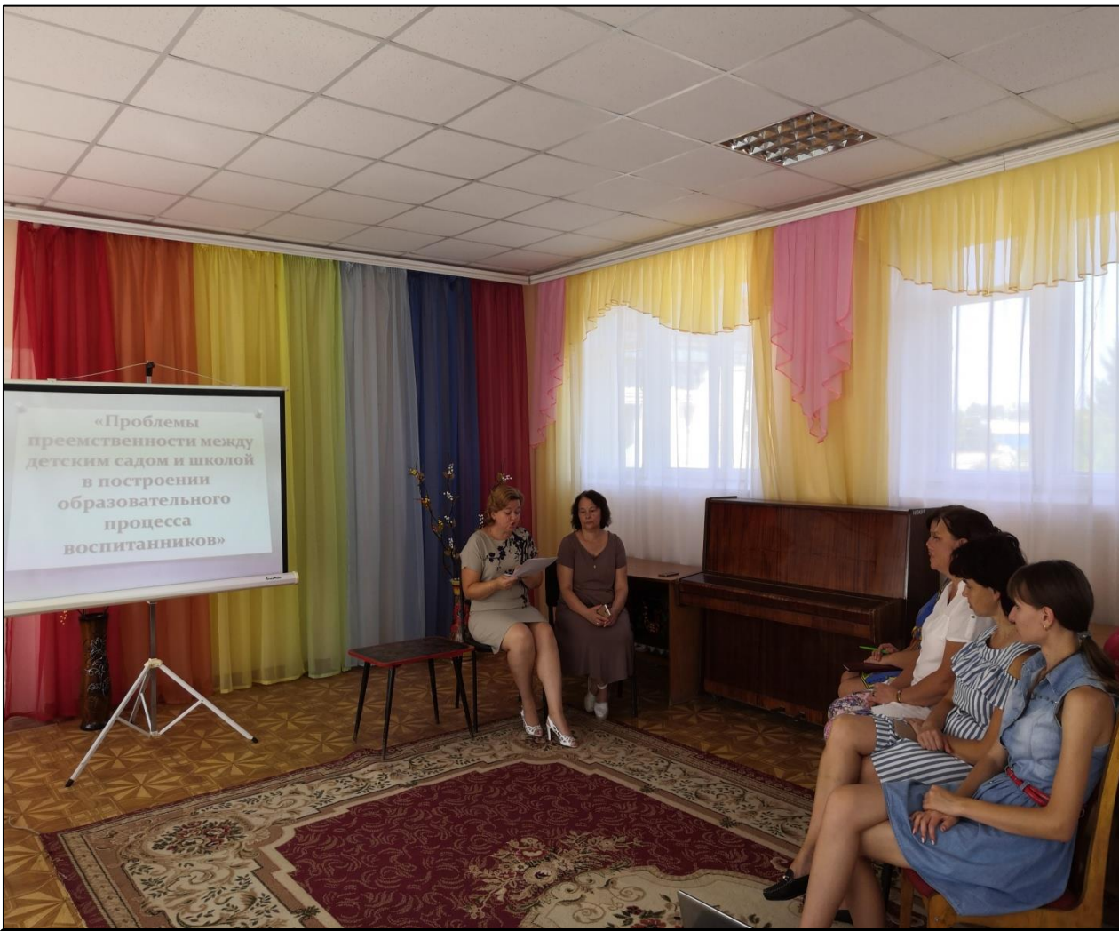
Час информационного обмена «Проблемы преемственности между детским садом и школой в построении образовательного процесса воспитанников»