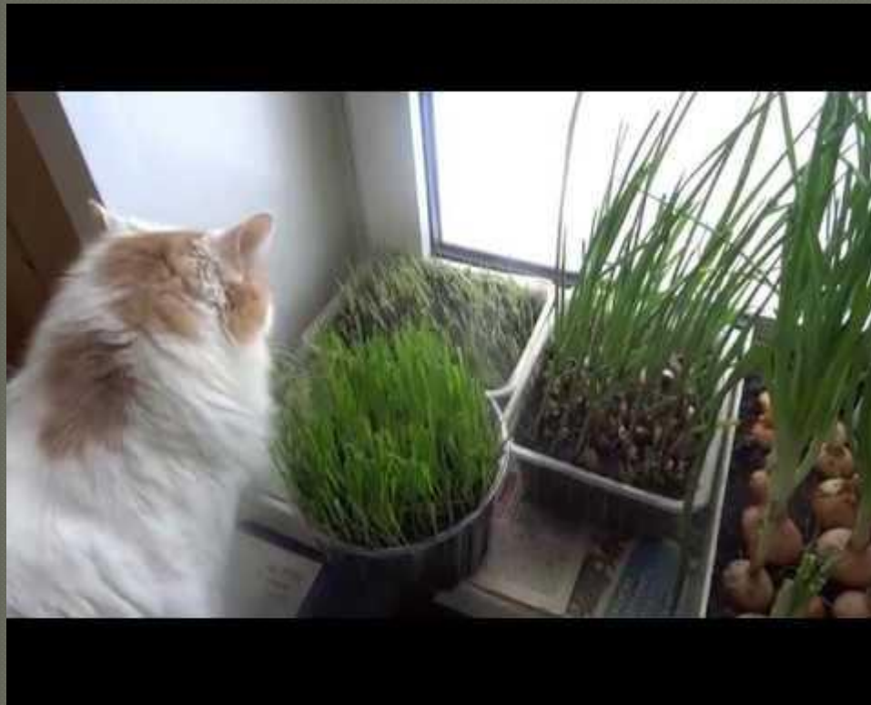
Фото моей кошки Кляксы «Удивительное лакомство»