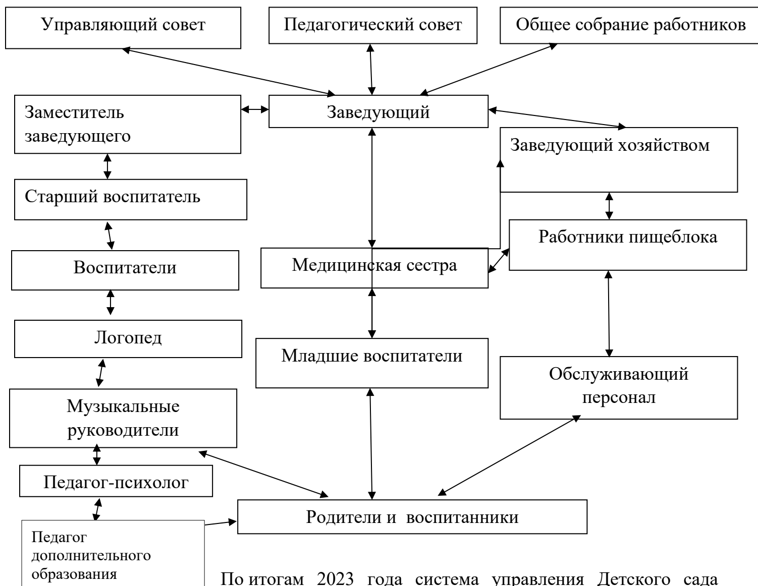
Схема взаимодействия коллегиальных органов управления Детского сада с работниками и родителями воспитанников

По итогам 2023 года система управления Детского сада оценивается как эффективная, позволяющая учесть мнение работников и всех участников образовательных отношений.