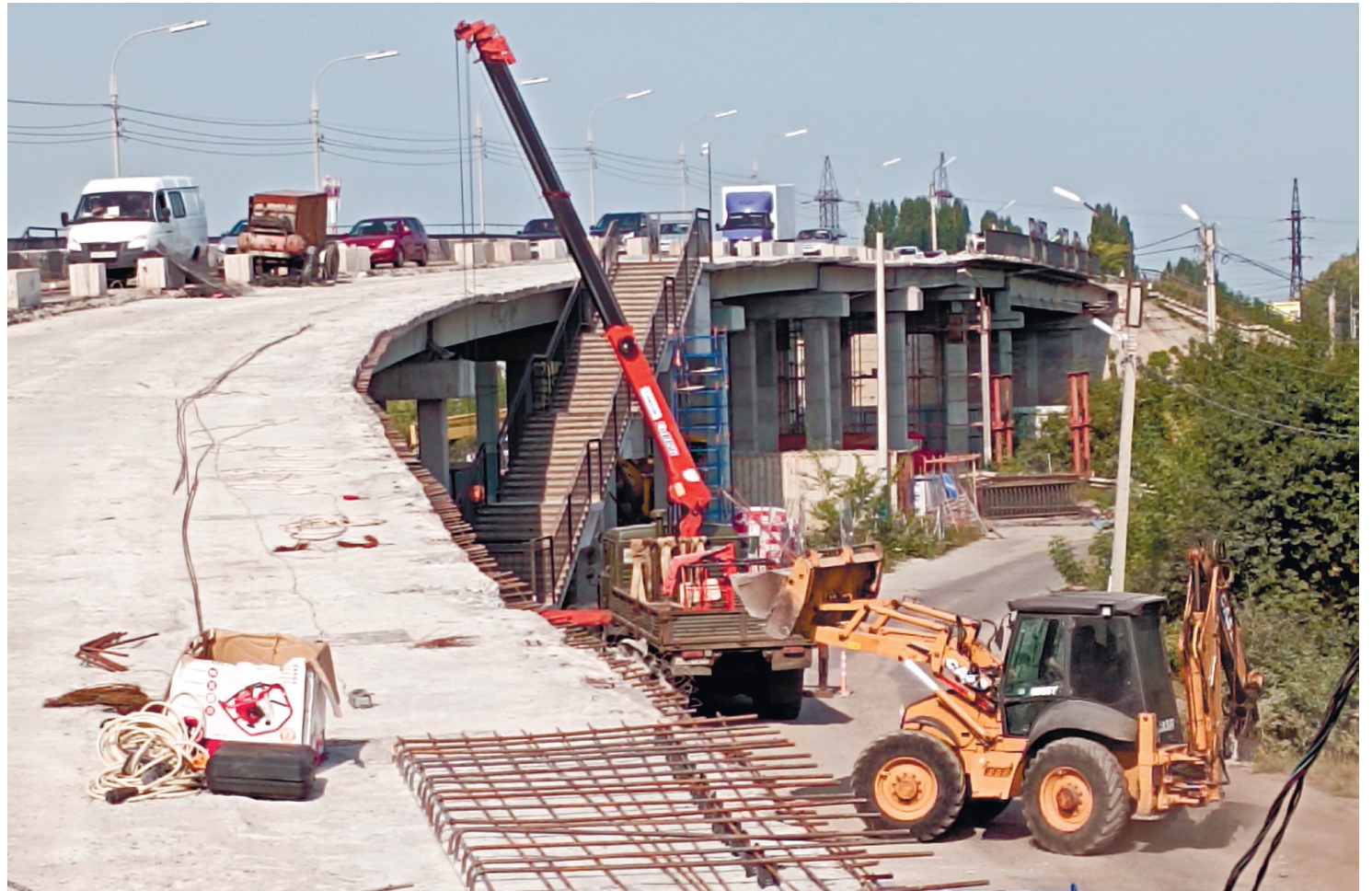
Ремонт путепровода на улице Лаврова

Вместе с тем прекрасно знаю, что системные проблемы не решаются по взмаху волшебной палочки. Нужно время, нужны ресурсы. И люди тоже это понимают. Никто не будет требовать от глав муниципалитетов невозможного. А исполнения своих обязанностей — будем требовать: и жители области, и я.